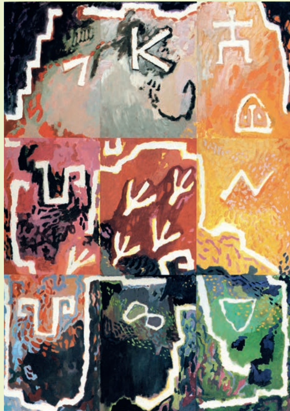
Iris Pagano de Dornier „Lied an Südamerika“